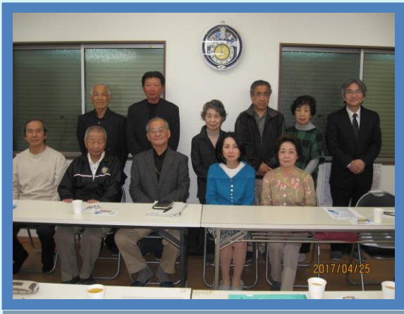
平成 29 年度南部地区連合会長会メンバー