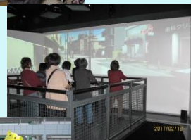
家庭防災部 市民防災センター見学→