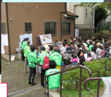
瀬戸ヶ谷古墳を知る「まち歩き」