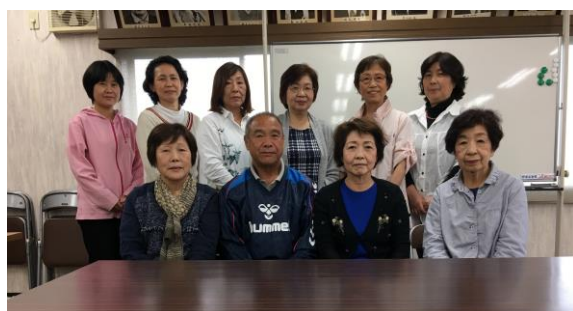
民生児童委員 よろしくお願ひします。