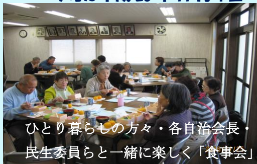
ひとり暮らしの方々・各自治会長・民生委員らと一緒に楽しく「食事会」

今号は平成 28 年 11 月 4 日～平成 29 年 4 月撮影の行事風景等の写真を掲載しております。