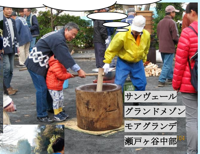
サンヴェール グランドメゾン モアグランデ 瀬戸ヶ谷中部 04