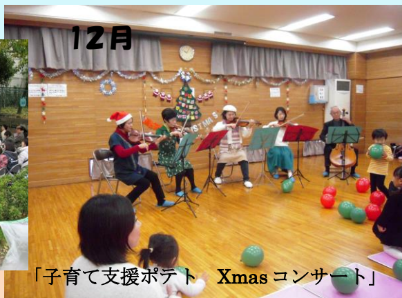
「子育て支援ポテト Xmas コンサート」