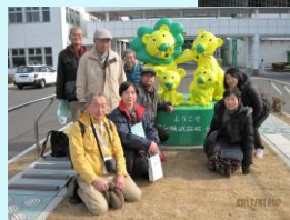
環境事業推進委員会 ←施設見学