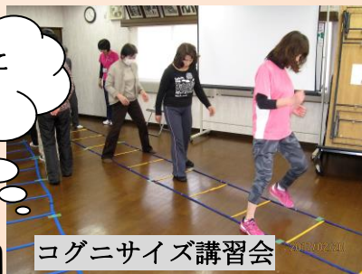
2月 コグニサイズ講習会 岩井町自治会館にて