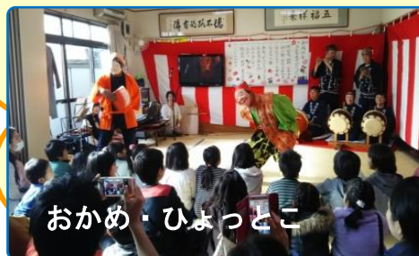
おかめ・ひょっとこ

1/7 今年も新桜ヶ丘自治会でお正月あそびの会を開催しました。獅子舞いや琴とヴァイオリンの合奏に始まり、コマ・カルタ・羽