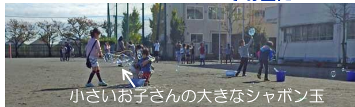
小さいお子さんの大きなシャボン玉