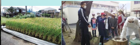
田植え・もちつき

稲ボラの協力で実施している5年の稲作が3年目を迎え、今年は花壇田んぼにもち米を植えました。たくさん実り12月に稲ボラ・二丁目自治会有志の方々の協力でもちつきをしました。