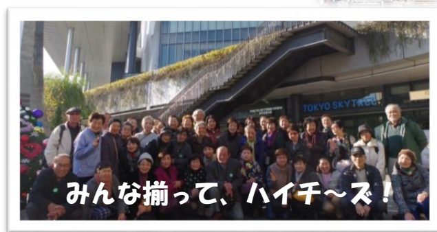
みんな揃って、ハイチ～ズ！