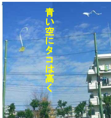
青い空にタコは高く

昨年11/12 晴れた空のもと藤塚小学校でボランティアを含む参加者365人の笑顔で開催されました。開会式では校長先生のお話と名人の演技披露があり、参加者も「私もやる!」と張り切りしました。成果の一部をご紹介します。