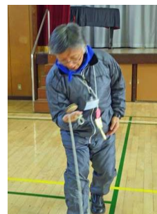
副校長先生の回る駒は手の上に