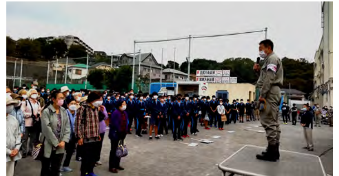
保土ヶ谷区長の挨拶