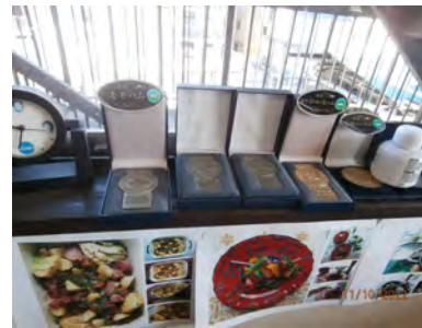
品評会での 受賞メダル

※日本ウィンナー(株)さんは、高級ブランドである「鎌倉ハム」を製造している一社でもあり、ハムの品評会で多くのメダルを受賞されています。