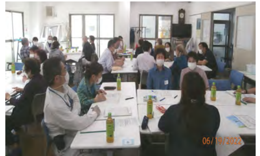
第7回ワールドカフェの様子