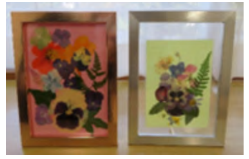
押し花を使ってフォトフレーム飾り を作りました