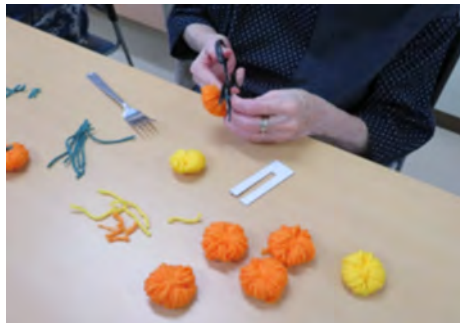
2022.10月ハロウィンリース作り