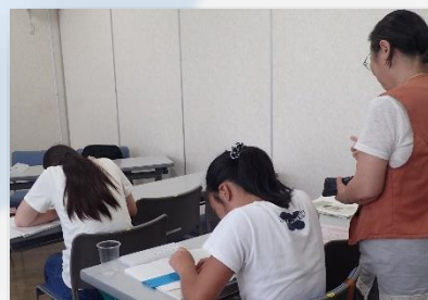
点字版を用いて名刺づくり☆