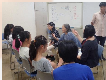
発表に備えて手話の特訓中！